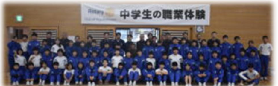
お世話になった東となみロータリークラブの方と記念撮影