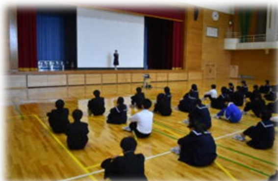
＜スタートセレモニーの様子＞

16日にスタートセレモニーが行われ、その後、第1回係会がありました。一人一役以上で準備に取り組んでいます。28日には保護者の皆様、地域の皆様のご来校をお待ちしております。