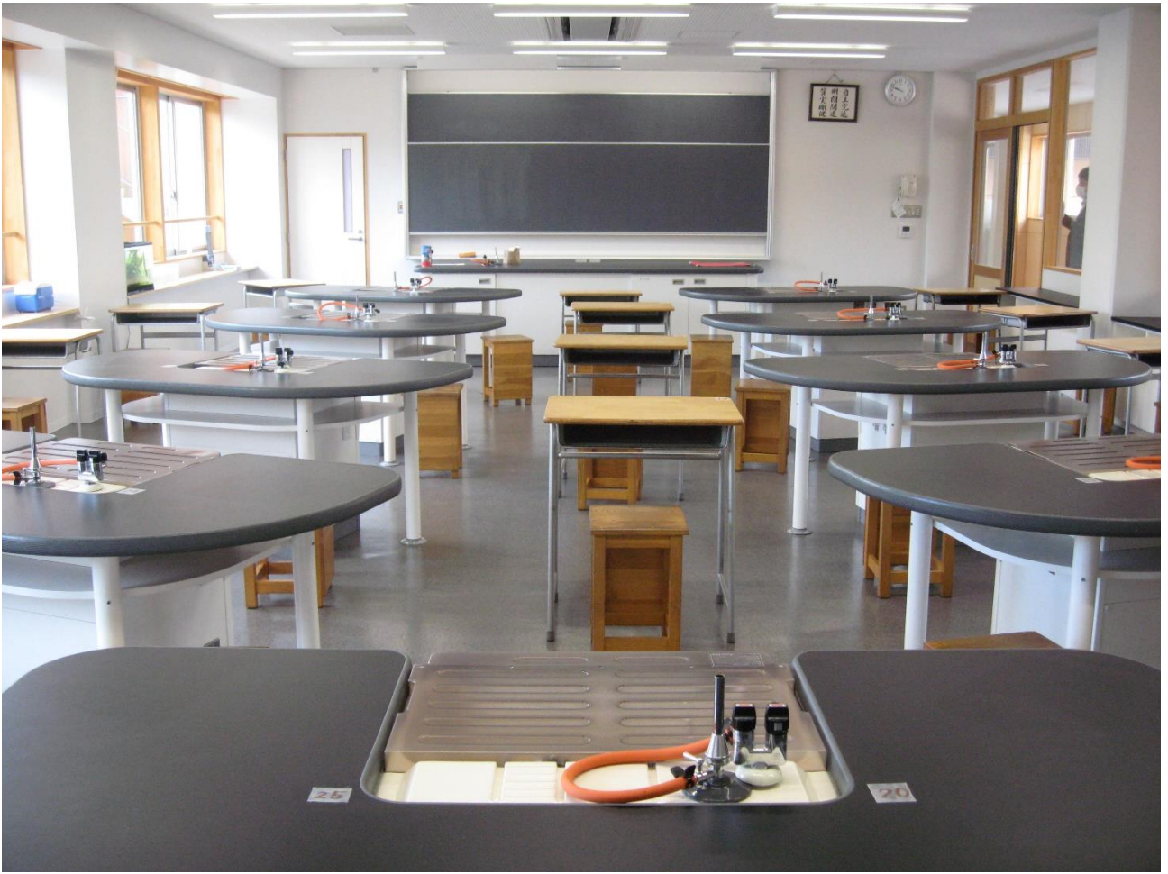
第 2 理科室