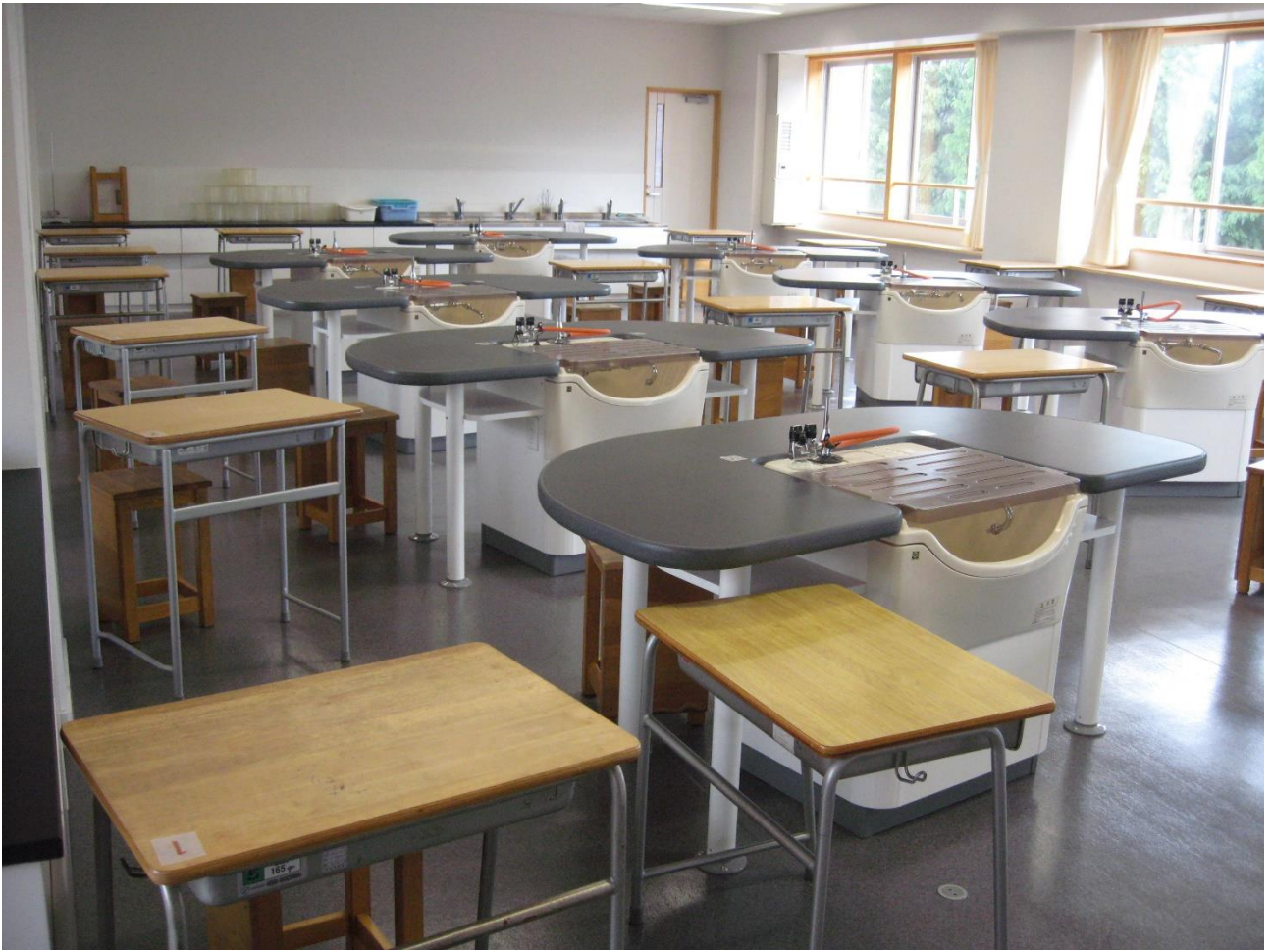
第 2 理科室